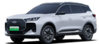
White Pearl with black roof*

*Piemaksa par divtoņu krāsojumu: 450EUR ar PVN 21%